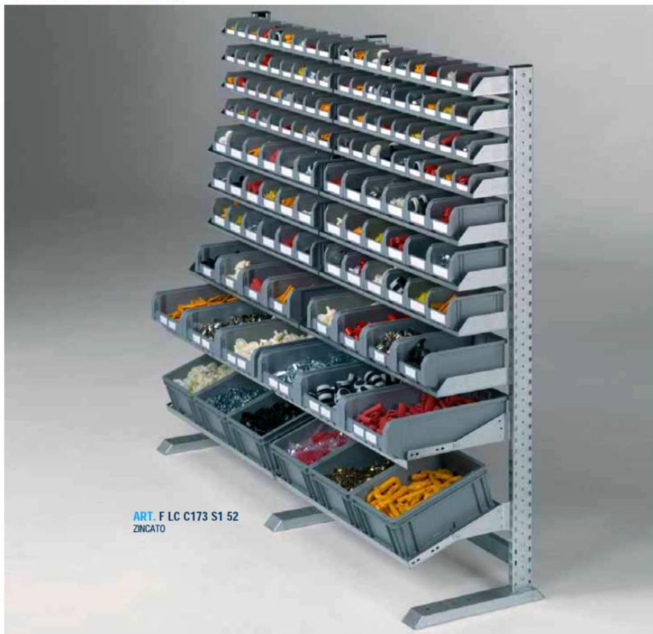
ART. F LC C173 S1 52 ZINCATO