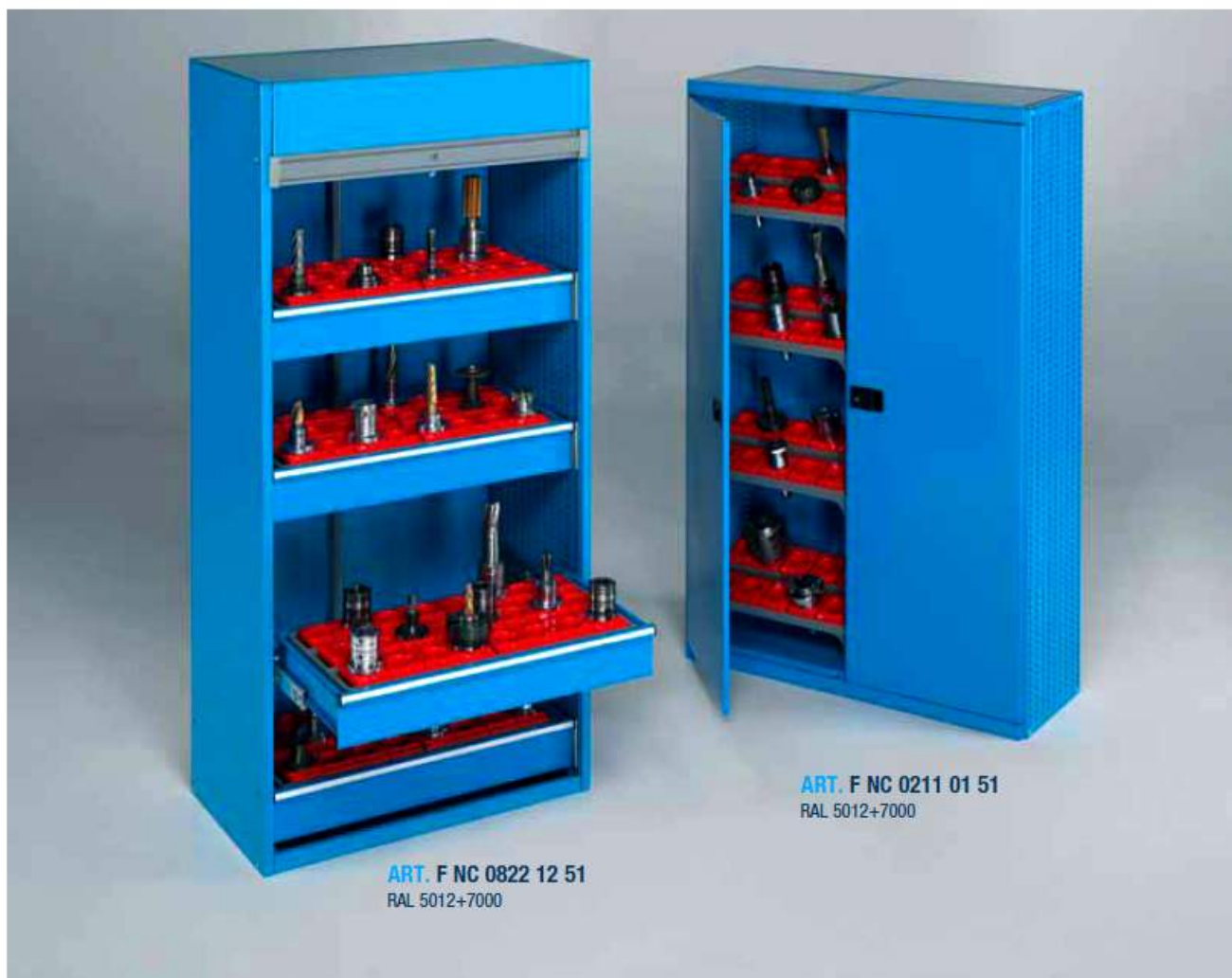
ART. F NC 0822 12 51 RAL 5012+7000